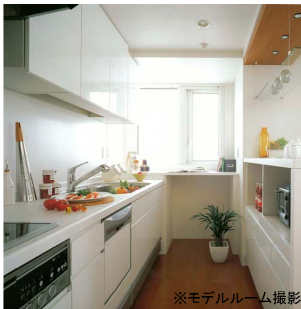
※モデルルーム撮影